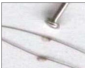
Luizen-eitjes (neten) en een speldenknop