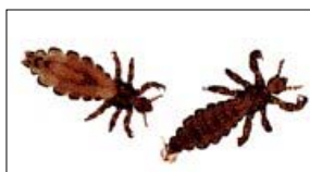
vrouwlijes-luis (links) mannetjes-luis (rechts)